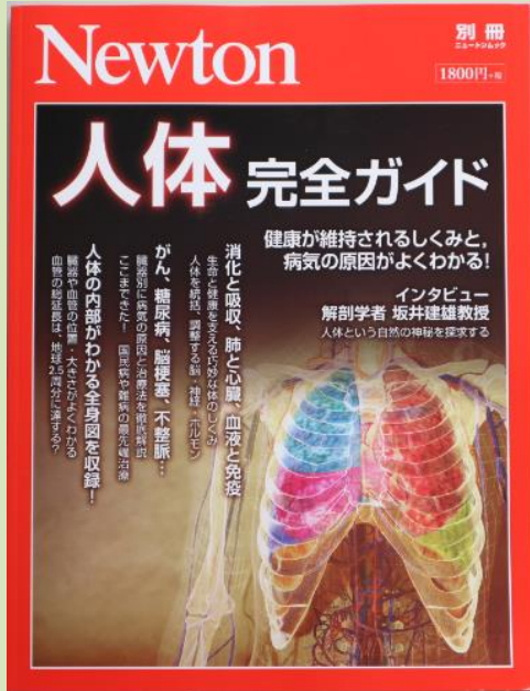
Newton別冊人体完全ガイド ★院内販売中★