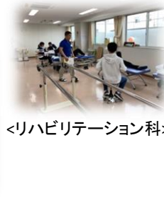
<リハビリテーション科>